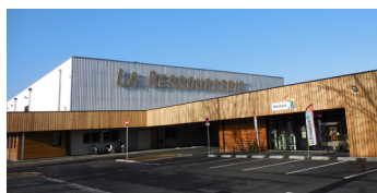
Façade de la Ressourcerie

La Ressourcerie est un outil de valorisation des déchets dont le rôle est de donner une seconde vie aux objets dont les propriétaires souhaitent se débarrasser. Une fois collectés, ces objets sont triés, contrôlés et si besoin nettoyés et réparés pour être ensuite revendus à très bas prix dans nos magasins. Bien plus que de la collecte, cette démarche s'inscrit dans une logique d'insertion professionnelle dans des personnes en difficulté, qui contribuent à la revalorisation de vos objets en leur donnant une seconde vie. Sur le territoire de la Communauté d'agglomération Hénin-Carvin, c'est l'association DIE (Dynamique Insertion Emploi) qui exploite cette Ressourcerie, 40 personnes en insertion y travaillent et sont encadrées par 8 personnes en poste fixe. Au moins 16 métiers différents sont ainsi proposés dans le cadre de l'Atelier Chantier d'Insertion (ACI) pour permettre au territoire d'offrir une alternative au décrochage social. Les bénéficiaires se voient accompagnés à la fois socialement et professionnellement par une équipe qualifiée et motivée de permanents de l'association DIE.