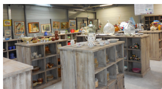
Espace de vente